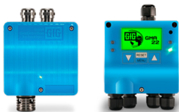
CC22 ex i kontroler GMA22-M

Wartości pomiarowe są transmitowane cyfrowo poprzez interfejs RS-485 Modbus. Szczególnie w połączeniu z kontrolerem