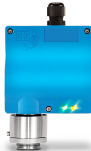
Analoge Variante des EC22 O mit einer Kabeleinführung

Die rechtzeitige Erkennung von Sauerstoffmangel wird allerdings erschwert, wenn ein sehr leichtes Gas wie Helium austritt, da dessen Gasdichte lediglich 0,14 beträgt (Luft = 1). Speziell zur Überwachung von Sauerstoff in Umgebungen mit Gasen mit niedrigem molekularem Gewicht wurde der EC22 O mit Partialdrucksensor entwickelt.